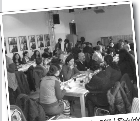
20 Şubat 2011 | Bielefeld

Oldukça sıcak ve samimi bir havada geçen kahvaltıda 8 Mart Dünya Emekçi Kadınlar Günü'ne katılım ve İstanbul'da direnişte olan Ontex işçileriyle dayanışma çağrısı yapıldı. Ayrıca kahvaltıdan elde edilecek paranın Ontex işçilerine dayanışma amacıyla gönderileceği duyurusu yapıldı. Bu destek çağrımız olumlu karşılandı. Kahvaltıya 70 kişi katılım sağladı, Sıcak ve samimi bir havada geçen kahvaltıya katılanlar memnuniyetlerini dile getirdiler. Kahvaltıdan sonra beraber halaylar çekildi. Kızıl Bayrak standı açıldı ve gazete satışı yapıldı.