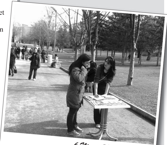
6 Nisan 2008 | Kadıköy

Genç komünistler için baharın tüm yoğunluğu ile birlikte dinamizmi ve devrimci ruhu yerel örgütlülüklerimizi güçlendirmek, kitle ilişkilerimizi yaygınlaştırmak ve politikalarımızı alanlarda etkin bir biçimde hayata geçirebilmek için değerlendirilmelidir. Düzenin saldırıları ve reformizmin tarihsel ayak oyunu karşısında kampüslerde mücadelenin kızıl bayrağını yükseltelim.