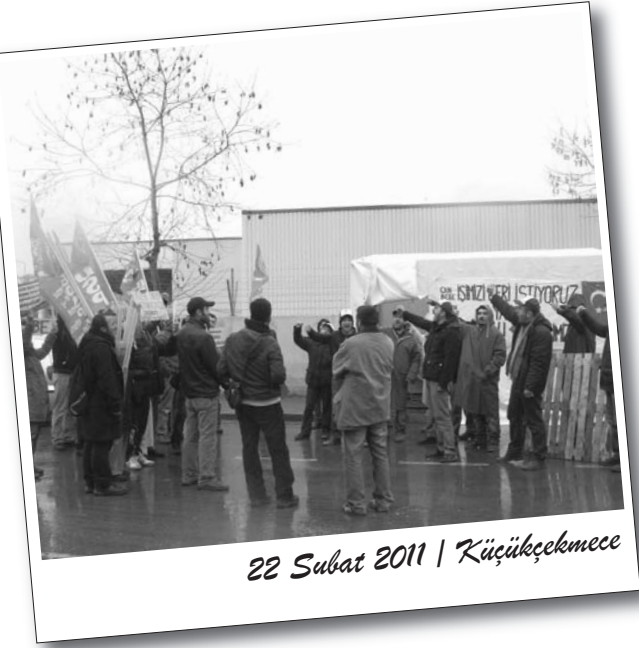
22 Şubat 2011 | Küçükçekmece

açıklamada sendika ve patron işbirliğiyle işten atıldıklarını belirten işçiler, direnişlerine işten atılan 16 işçi işe geri dönene kadar devam edeceklerini söylediler.