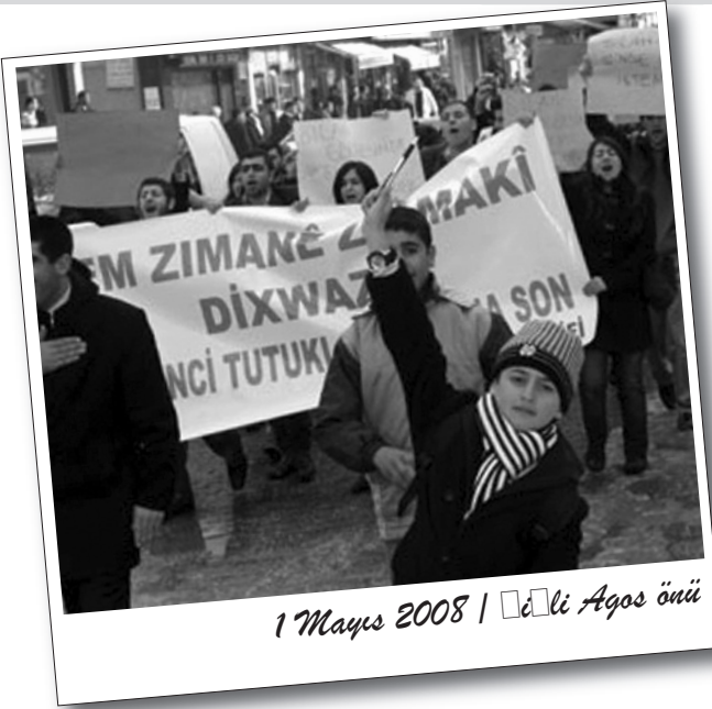
1 Mayıs 2008 | İcili Aqos öüü